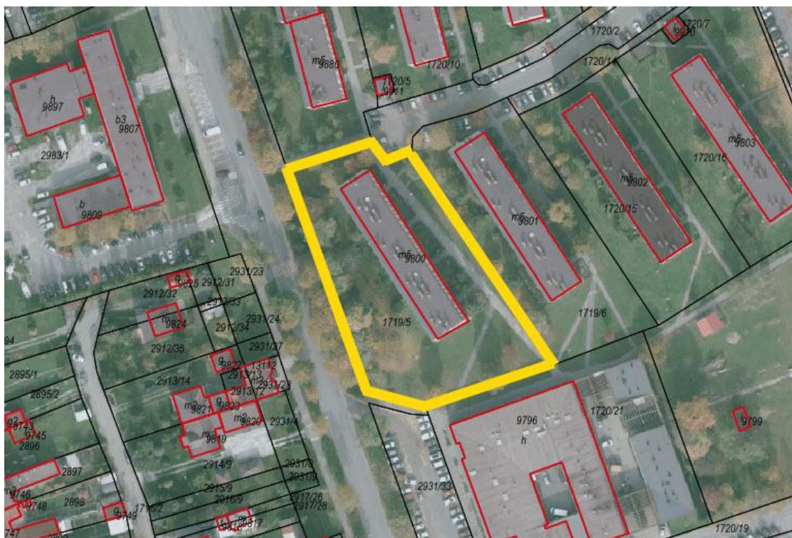
Rysunek 1. Orientacja

Przedmiotem opracowania jest dokumentacja dot. remontu lokalu mieszkalnego na os. 700-Lecia 5/27 w Żywcu. Przedmiotowy lokal mieszkalny znajduje się na III piętrze.